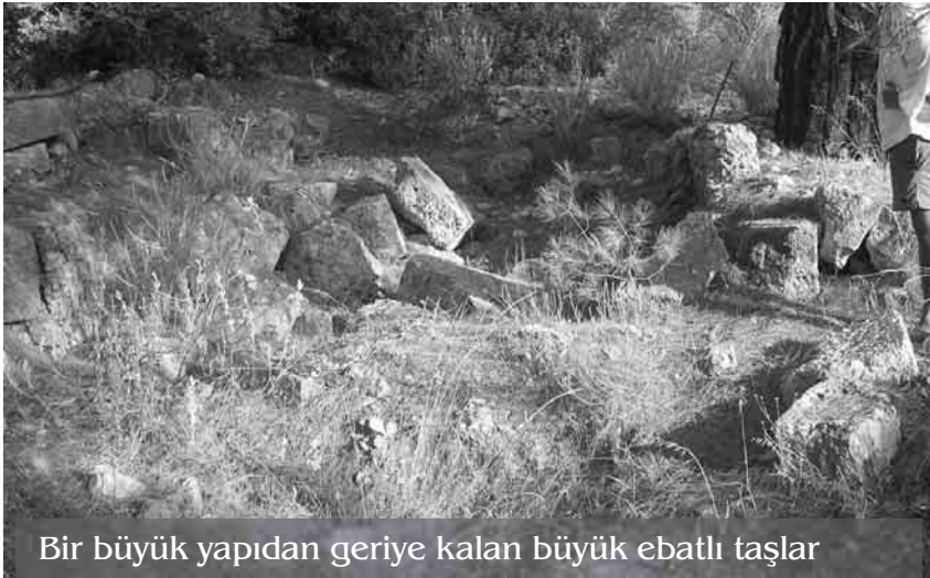
Bir büyük yapıdan geriye kalan büyük ebatlı taşlar

Şimdilik Hayıtlı gizemini korumaktadır. Aşağıda yer yer görülen büyük bir yapıdan kalan büyük taşları gösteren bir fotoğraf görülmektedir.